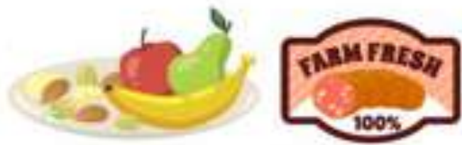
ผลิตภัณฑ์พืชผักที่เน่าเสีย และผลิตภัณฑ์จากสัตว์