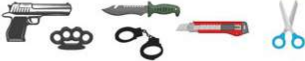
อาวุธ ของมีคมทุกชนิด