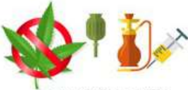
ยาเสพติดทุกชนิด