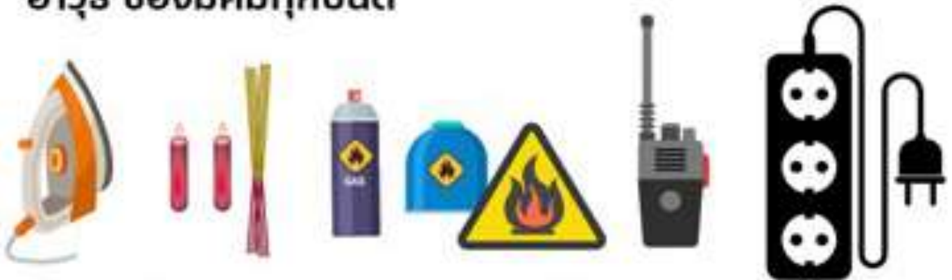
สิ่งที่ทำให้เกิดความร้อน และเปลวไฟทุกชนิด รวมถึงวิทยุเครื่องข่าย และปลั๊กไฟพ่วง