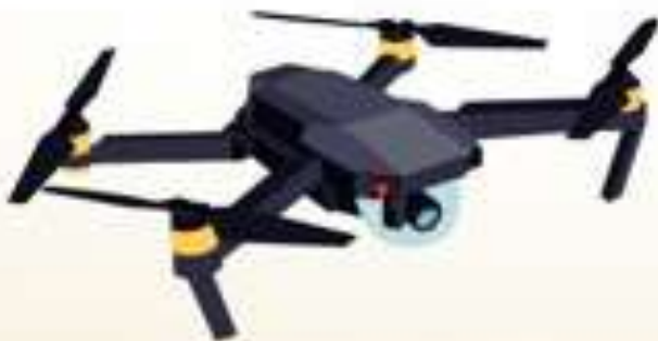
ห้ามใช้โดรนถ่ายภาพบนเรือ หากท่านจะนำโดรนไปถ่ายภาพบนฝั่ง จะต้องทำเรื่องขออนุญาตก่อนทุกที

หมายเหตุ : หากตรวจพบสิ่งของต้องห้าม หรือต้องสงสัยทุกชนิด ทางเรือจะเก็บกระเป๋าของท่านไว้ที่หน่วยรักษาความปลอดภัย และจะเก็บสิ่งของเหล่านั้นไว้ จนกว่าจะถึงวันขึ้นจากเรือ จึงจะคืนสิ่งของให้ท่าน