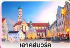
อาคส์บวร์ค