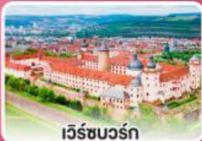
เวิร์ชบวร์ค