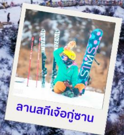
ลานสกีแจ๊วกู่ซาน