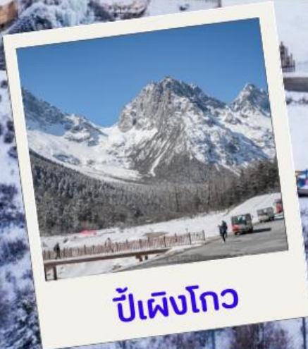
ปีเผิงโกว