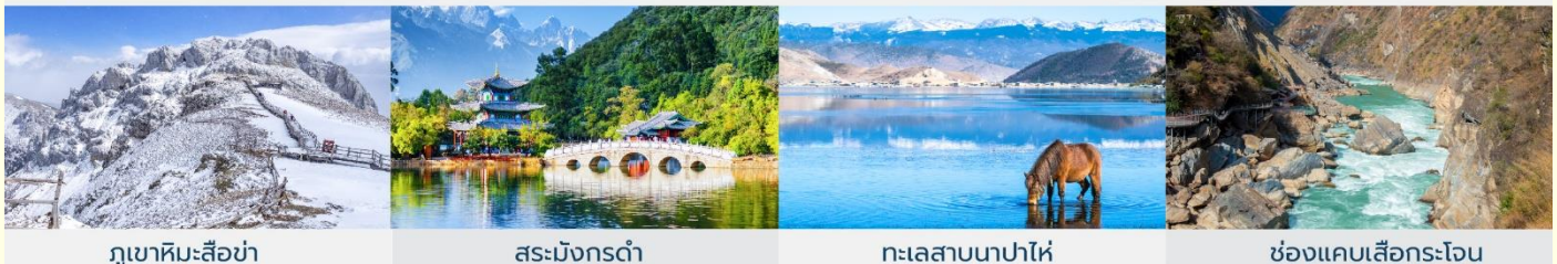
ภูเขาหิมะสี่ขา