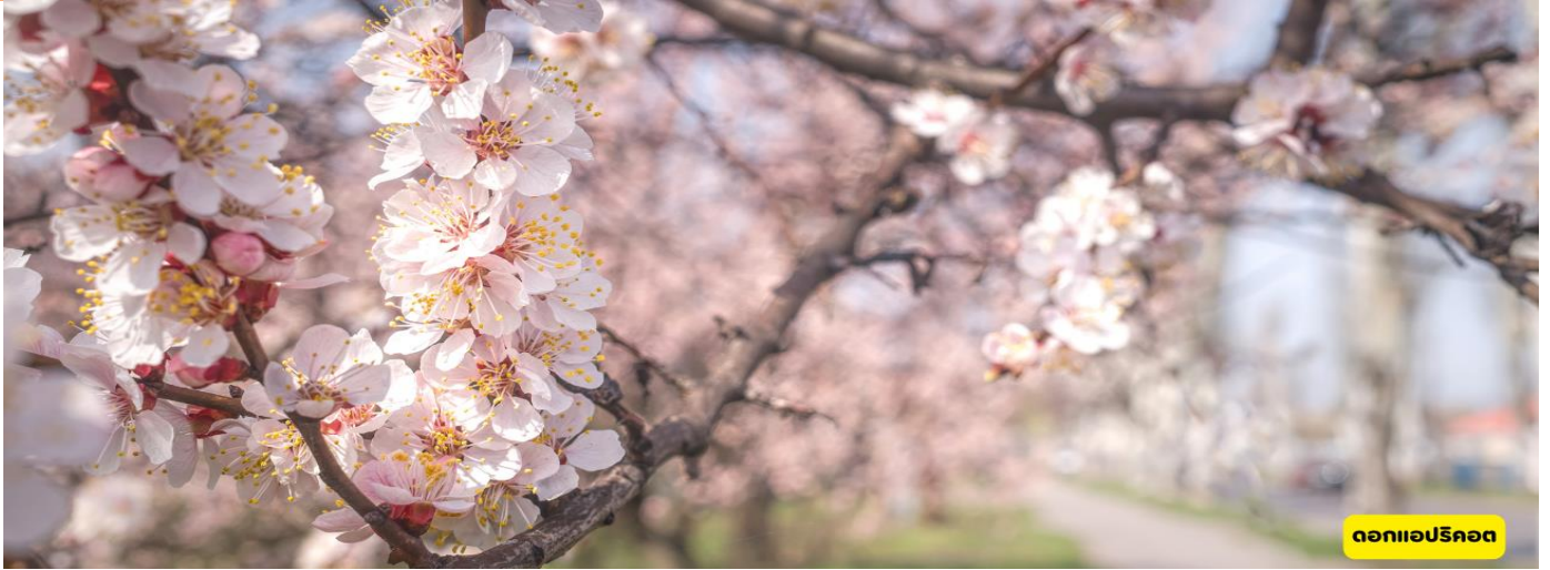
ดอกแอปริคอต