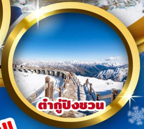
ต่ากู่ปิงชว่น

ชมความงาม 3 อุทยาน สี่ดรุณี , ปี้เฟิงโกว , ต่ากู่กลาเซียร์ (รวมรถอุทยาน+กระเช้าขึ้น-ลง) ชมความน่ารักของน้องหมีแพนด้าถ่ายรูปร่วมกับแลนด์มาร์คยอดฮิต " หมีแพนด้าเซลฟี่ " ซุปบิ่งสุดมันส์ ณ ถนนคนเดินซุนซีลู่ ทะลุซ้อบบิ่งที่