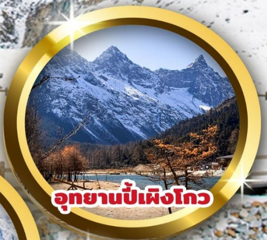
อุทยานปี้เฟิงโกว