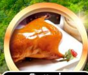
เป็ดปักกิ่ง