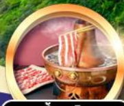
สุกี้มอโก