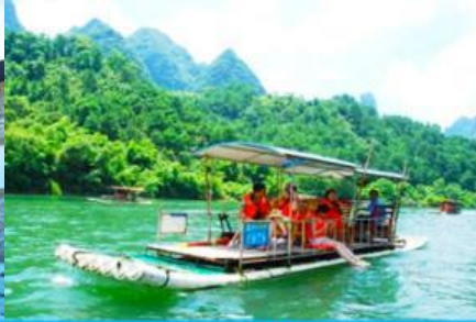
ล่องแพไม้ไผ่