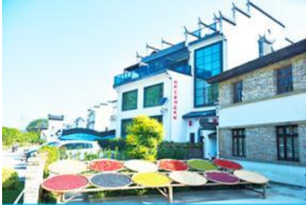
หมู่บ้านโบราณ สือหมินซุน