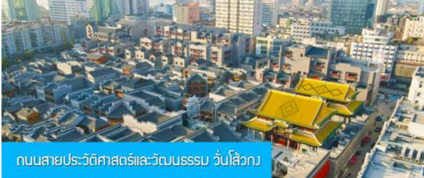
ถนนสายประวัติศาสตร์และวัฒนธรรม วันไ้่วกง

พักที่ โรงแรม JIANGNAN HAOTING HOTEL ระดับ 4 ดาวท้องถิ่นหรือเทียบเท่าในเมืองซ่งเหรา