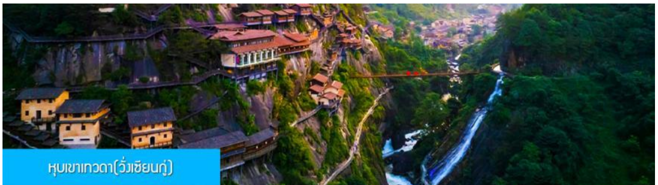
หุบเขาเทวดา(วังเซียนกู่)

หลังอาหารเช้าท่านเดินทางสู่เมือง ซังเหรา 上饶 (ระยะทาง 127 กม. ใช้เวลาเดินทางโดยรถบัสราว 2 ชั่วโมง)