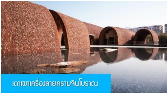
เตาเผาเครื่องลายครามจีนโบราณ