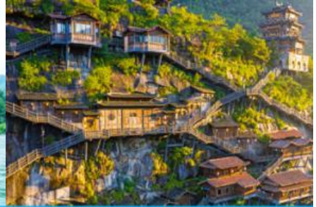
อุทยาน วังเซียนกู่