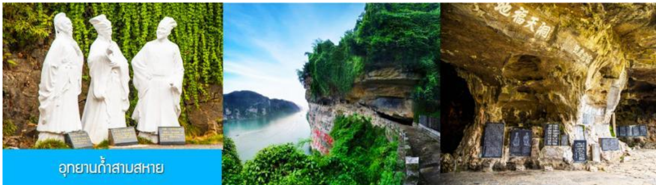
อุทยานถ้ำสามสหาย