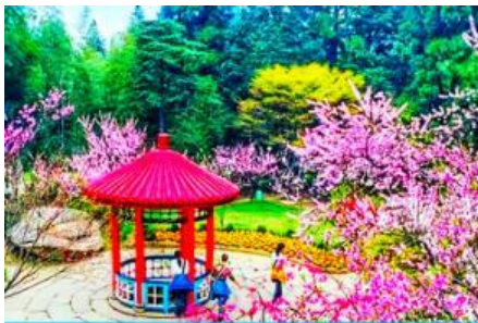
สวนฮวาจิ้ง