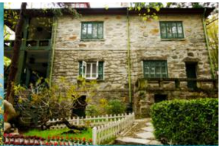
เรือนรับรอง หม่ยหลู