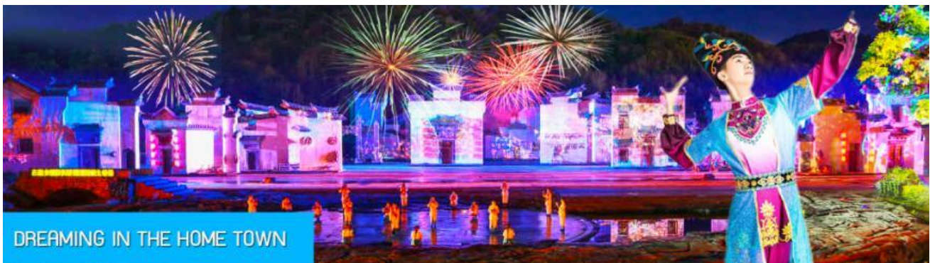
DREAMING IN THE HOME TOWN

หลังอาหารนำท่านเดินทางเข้าที่พัก หรือท่านสามารถเลือกซื้อโปรแกรมเสริม เป็นบัตรชมการแสดง ชุด