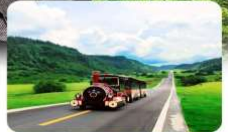
อุทยานเขานางฟ้า

เมนูพิเศษ สุกี้หม่าล่า เปิดปักกิ่ง เปิดอย่างฉงชิ่ง