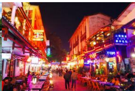
ถนนคนเดิน ซิเคียวหรือถนนเฟรี่