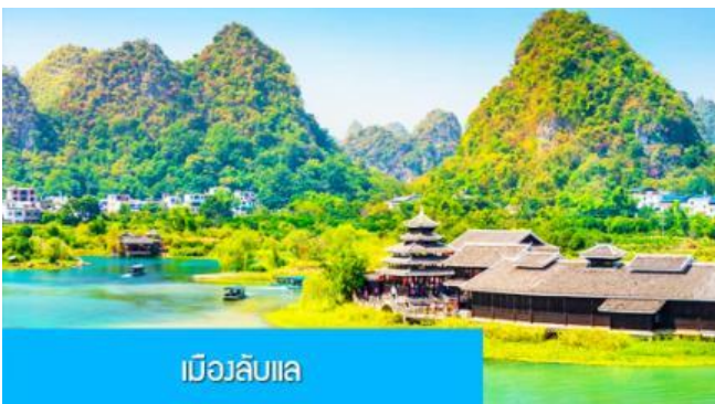
เบิวลิบแล