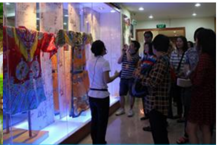
ร้านผ้าไหม

16/4 เมืองกุ้ยหลิน –เขางวงช้าง-ศูนย์จำหน่ายผ้าไหม-สวนเจ็ดดาว-เขาคูรู-วัดซีเตี้ย-ศูนย์จำหน่ายหยก-จันทรไฟความเร็วสูงสู่เมืองหนานหนิง