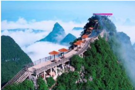
บันไดกระเช้าขึ้นเขาหญู่ฝิง

พักที่ YANGSHUO ELITE GARDEN HOTEL ระดับ 4 ดาวท้องถิ่นหรือเทียบเท่าใน เมืองหยางชว่