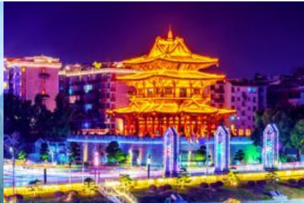
หอชิวเวหยาโหลว