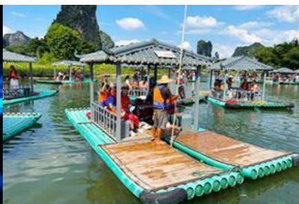
ขั้วเรือแพชมแม่ น้ำหลิว