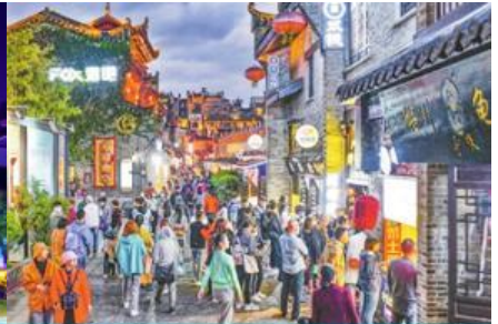
ย่าน ตงซีเซียง