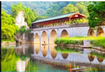
สวนเจ็ดดาว