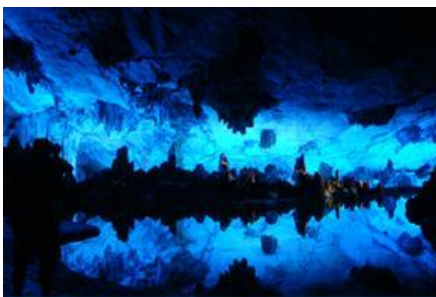
ถ้ำขลุ่ยอ้อ

พักที่ GUILIN VIENNA HOTEL โรงแรมระดับ 4 ดาวห้องถึง หรือเทียบเท่าในเมืองกุ้ยหลิน