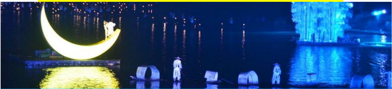
The Impression of Liu Shan Jie

หลังอาหารนำท่านเดินทางเข้าที่พัก หรือท่านสามารถเลือกซื้อโปรแกรมเสริม เป็นบัตรชมการแสดง ชุด The Impression of Liu shan jie หรือที่เรียกกันในหมู่นักท่องเที่ยวไทยว่า โชว์แม่น้ำ เป็นการแสดงบนแม่น้ำหลีเจียงที่ทุ่มทุนสร้างอย่างสุดอลังการ เป็นการแสดงที่น่าดูชมที่สุดในเมืองกุ้ยหลิน การแสดงชุดนี้ใช้แม่น้ำหลีเจียงเป็นเวทีการแสดง โดยมีฉากหลังเป็นภูเขาริมแม่น้ำ ซึ่งให้ความรู้สึกสมจริงเสมือนผู้ชมและนักแสดงอยู่ท่ามกลางธรรมชาติ ใช้ทีมงานนักแสดงหลายร้อยคน และระบบแสง สี เสียงที่ทันสมัยประกอบในการแสดง