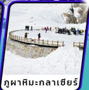
ภูฟ้าหิมะกลาเซียร์

อุทยานสวรรค์ต่ากู่ปิงชว่น & กูเขาสีดรุณี (รวมรถอุทยานทุกจุด)