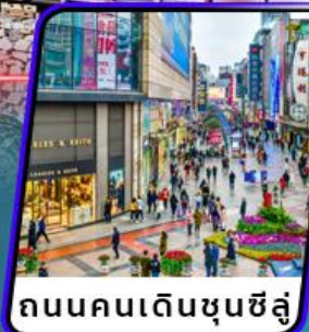
ถนนคนเดินชุนซีลู่