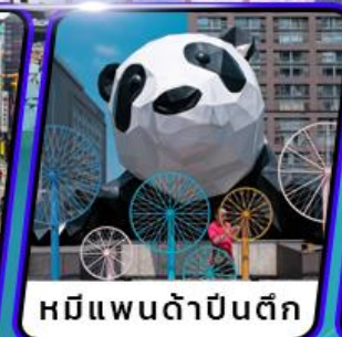
หมีแพนด้าปิ่นตึก