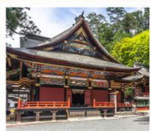
ศาลเจ้ามิตสึมิเนะ