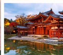
วัดเบียวโดอิน