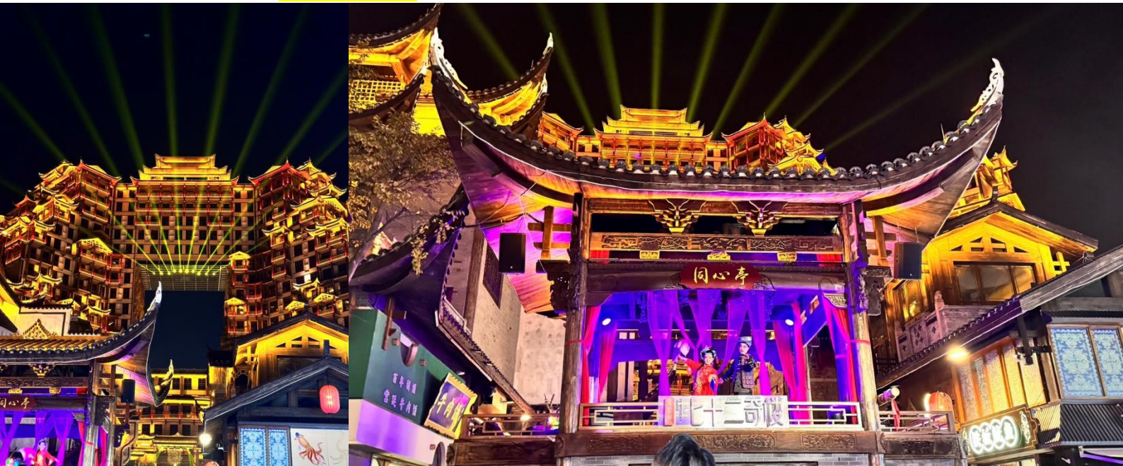
นำทุกท่านเข้าสู่ที่พัก IMPRESSION HOTEL ระดับ 4 ดาวท้องถิ่นหรือเทียบเท่า

จากนั้นนำท่านชม ตึกมหัศจรรย์ 72 แห่งเมืองจางเจียเจี๋ย แลนด์มาร์คใหม่ล่าสุดที่เป็นเสมือนแม่เหล็กดึงดูดนักท่องเที่ยวและผู้มาเยือน ถูกสร้างขึ้นโดยนำเอาจุดเด่นของเมืองจางเจียเจี๋ยมารวมกัน โดยมีอาคารสูงที่สร้างจำลองถ้ำประตูสวรรค์ บ้านยกพื้นโบราณที่เป็นบ้านพื้นเมืองของชาวฉู่เจีย นอกจากนี้ที่นี่ยังถูกออกแบบให้กลายเป็นแหล่งรวมของ รีสอร์ท โฮมสเตย์ ร้านอาหาร ผังสตรีทฟู้ด ผับบาร์ ร้านขายของที่ระลึก ที่ตกแต่งด้วยแสงสีสุดอลังการ (รวมบัตรเข้าชม)