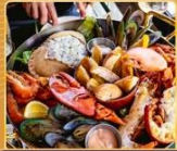
บิงย่าง นานาชาติ

โปรแกรมการเดินทาง 5 วัน 3 คืน : เดินทางโดยสายการบิน ไทย ไลออน แอร์ THAI LION AIR (SL)