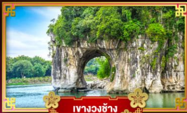
เขาวงช้าง

เที่ยวชมอุทยานซากุระหมีนโร "เขื่อนดินแดนแห่งขุนเขาและสายน้ำ หยางชิว"