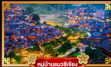
หมู่บ้านแมวซีเจียง