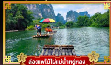
ล่องแพไม้ไผ่แม่น้ำหยูหลง