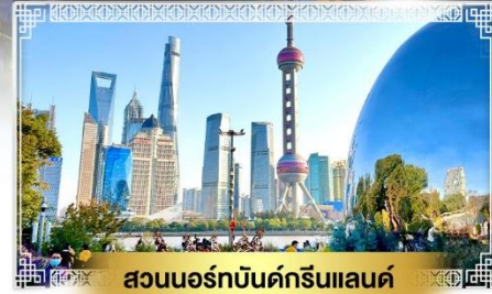
สวนนอร์ทัมดกรีนแลนด์