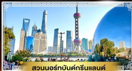
สวนนอร์มัลด์กรีนแลนด์