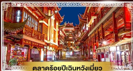
ตลาดร้อยปีเงินหวังเมี่ยว

📅 เดินทาง : 10-15 เม.ย. | 12-17 เม.ย. 68