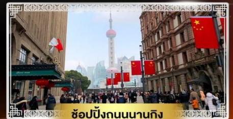
ช้อปปิ้งถนนนานกิง