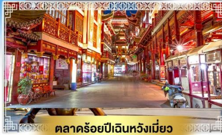
ตลาดร้อยปีเดินหวังเหมียว