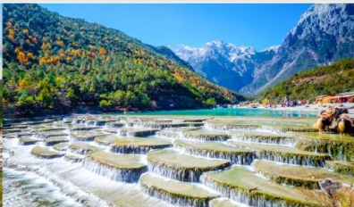
ทะเลสาบไป๋สุ่ยเหอ