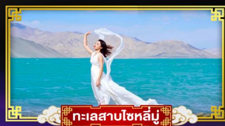
ทะเลสาบโซหลูมู