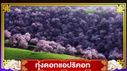
ทุ่งดอกแอปริคอต