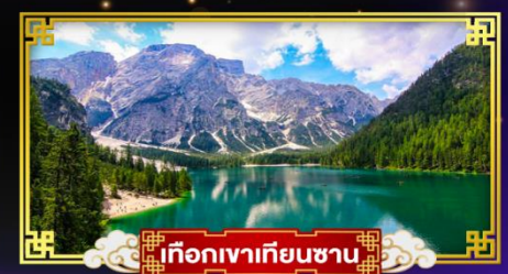
เทือกเขาเทียนชาน