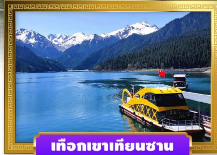
เทือกเขาเทียนซาน