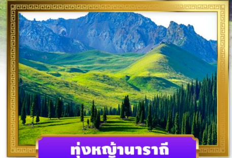
หุบเขานาราตี