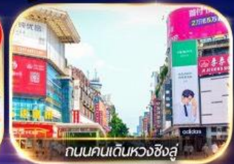
ถนนคนเดินหวงซิงสู

ล่องเรือชมเมืองโบราณ ฟุรงเจิน + ทะเลสาบเป่าเฟิงหู