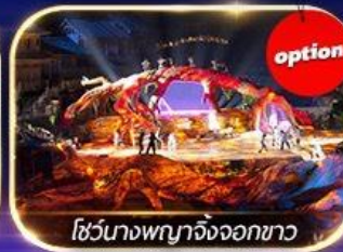
โชว์นางพญาจิ้งจอกขาว