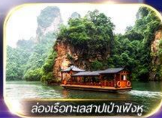
ล่องเรือทะเลสาบเป่าเฟิงหู