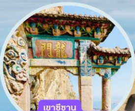
เขาซีซาน รวมกระเช้า+รถแคบเตอร์

วัดเจ้าแม่กวนอิม เมืองโบราณแชงกรีล่า วัดชวงจันหลิน ช่องแคบเสือกะโรน (รวมค่าบันได) เมืองโบราณลี่เจียง อุทยานภูเขาหิมะมังกรหยก (รวมกระเช้าใหญ่ไป-กลับ) ชมโชว์ความประทับใจแห่งลี่เจียง อุทยานน้ำหยก