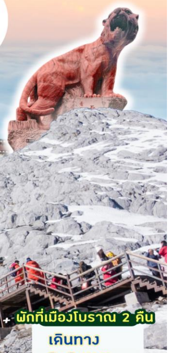
+ พักที่เมืองโบราณ 2 คืน

เดินทาง 3-8 เม.ย. 9-14 เม.ย. 13-18 เม.ย.