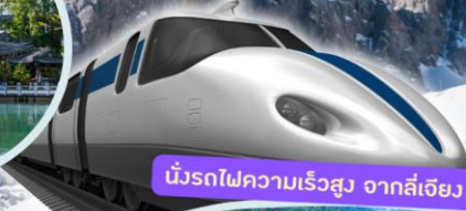
นั่งรถไฟความเร็วสูง จากลี่เจียง ไปคุนหมิง