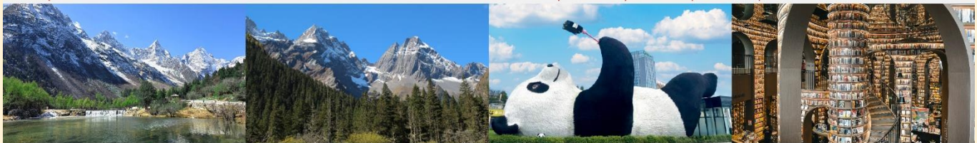
อุทยานแห่งชาติปี้เฟิงโก ภูเขาสี่ดรุณี (หุบเขาชวงเฉียวโกว) รูปปั้นหมีแพนด้าอนเซลฟ์ ร้านหนังสือจุงชู่เก้อ