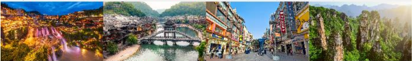
ฝูหลงเจิน