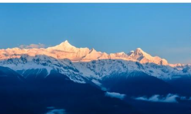
ภูเขาหิมะเหมยลี่