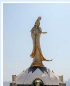
เจ้าแม่กวนอิม ปราสาททองริมทะเล