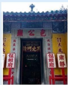
วัดเปากง