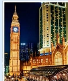
เดอะ ลอนดอนเนอร์