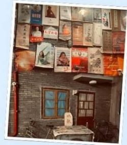
คาเฟ่ย้อนยุคเหอผิง