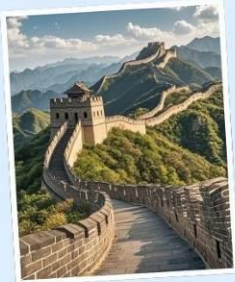
กำแพงเมืองจีน ด่านมู่เถียนยวี่