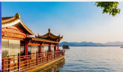
ล่องเรือชมทะเลสาบซีหู