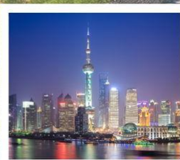
SHANGHAI CLASSIC NIGHT

Pudong Art Museum / Disney Flagship Store / Top Toy Flagship Store / เซี่ยงไฮ้ คลาสสิก ไนท์ / Music gate x Manner Coffee Rockbund Shamei Building / Tian An 1,000 Trees Square / ลิกซ์ฮิวรี่ แลนด์มาร์ก จางหยวน / ถนนคนเดินหวยไห่ SONGMOUNT ถนนอันฟู (13DE MARZO) / กำแพงเมืองจีนด้านจหยงกวน / ถนนโบราณหนานหลิวกู่เซียง / จัตุรัสเทียนอันเหมิน พระราชวังกู้กง / หอฟ้าเทียนถาน / คาเฟ่ย้อนยุคเหอผิง / วัดลามะยงเหอกง