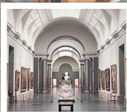
PUDONG ART MUSEUM