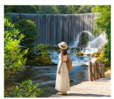
อุทยานเสี่ยวซีซิง