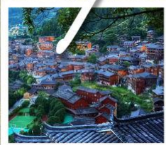
หมู่บ้านแม้วซีเจียง

อันซุ่น · น้ำตกหวงกั๋วซู่ · หมู่บ้านแม้วซีเจียง