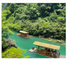
อุทยานต้าซีซิง