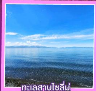
ทะเลสาบโซลีมู