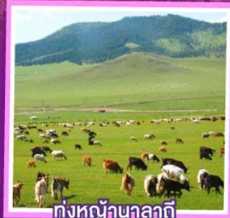
ทุ่งหญ้าภกลกติ