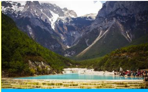
อุทยานโป๋สู่ยเหอ (หุบเขาพระจันทร์สีน้ำเงิน)