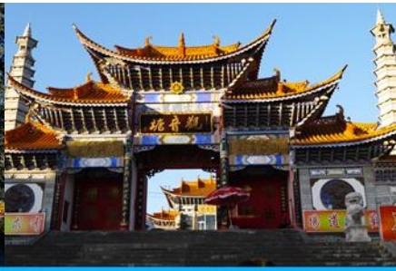
วัดเจ้าแม่กวนอิมเปलगาย