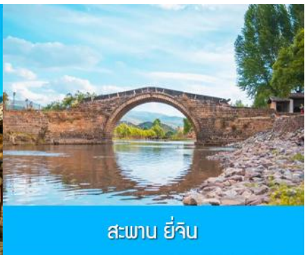
สะพาน ยี่จิ้น

หลังอาหารนำท่านเที่ยงชม หมู่บ้านโบราณซาซี 沙溪古镇 ชุมชนโบราณเก่าแก่ที่มีอายุกว่า 1,200 ปี เป็นชุมทางสำคัญของพ่อค้าเกลือและพ่อค้าชาที่คึกคักในอดีต ชม สะพาน ยี่จิ้น 玉津桥 สะพานโค้งโบราณจีนอายุกว่า 350 ปีที่เป็นสะพานที่คาราวานขนส่งสินค้าจากเหนือลงใต้ หรือจากใต้ขึ้นเหนือต้องใช้เป็นทางผ่าน ซึ่งได้ชื่อว่าเป็นสะพานอันดับหนึ่งในดินแดน