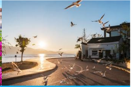
ย่านชายหาดรูป S