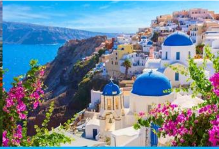
ย่านซานโตรินี่