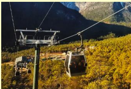
บึงกระเช้าสถานี หุบเขาผิง

หรือท่านสามารถเลือกซื้อโปรแกรมเสริม OPTIONAL TOUR แพคเกจท่องเที่ยวภูเขาหิมะมังกรหยกแบบครึ่งวัน อัตราค่าบริการท่านละ 3,500 บาท ในอัตราค่าบริการรวมรายการดังนี้