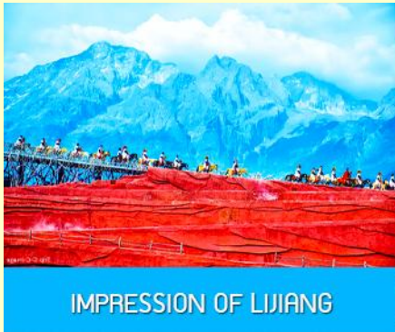
IMPRESSION OF LIJIANG