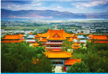
เมืองต้าหลี่