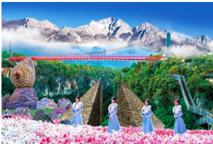
Snow Mountain Canyon Park

พักที่ LIJIANG FENGHUANG HOTEL โรงแรมระดับ 4 ดาวท้องถิ่น หรือเทียบเท่าในเมืองลี่เจียง