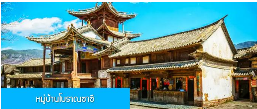
หมู่บ้านโบราณซาซี