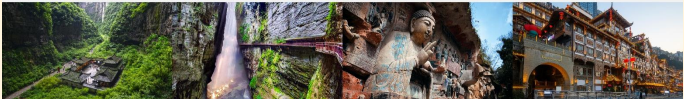
อุทยานแห่งชาติหลุมฟ้า 3 สะพานสวรรค์