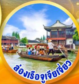
ล่องเรือซูเจียเจียว