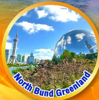
North Bund Greenland