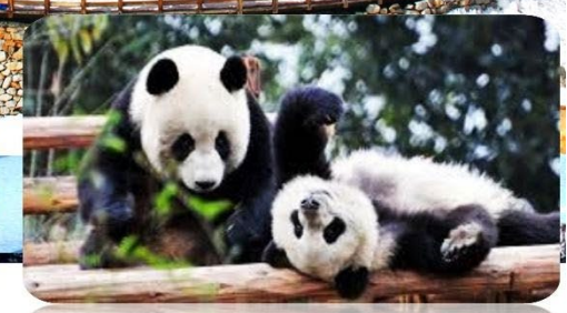
ศูนย์วิจัยหมีแพนด้า

เมนูพิเศษ สุกี้หม่าล่า บุฟเฟ่ต์ / เปิดปีกก๊อง 6 วัน 5 คืน เดินทาง : ม.ค. – มี.ย. 68