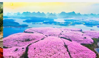
อุทยานชากระหมื่นไร่

*ทางบริษัทฯ ขอสงวนสิทธิ์ในการสลับโปรแกรมทัวร์ตามความเหมาะสมขึ้นอยู่กับสถานการณ์หน้างาน โดยคำนึงถึงผลประโยชน์ของลูกค้าเป็นสำคัญ