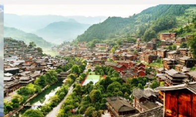
หมู่บ้านชนเผ่าแม่วซีเจียง