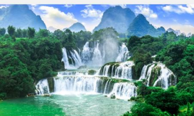
น้ำตกเต๋อเทียน