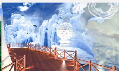
ถ้ำน้ำแข็งหลงกง