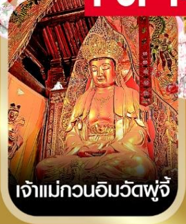
เจ้าแม่กวนอิมวัดฟูจี้

✈️ คอนเฟิร์มออกเดินทาง ✈️ ทุกพีเรียด 2 ท่านขึ้นไป