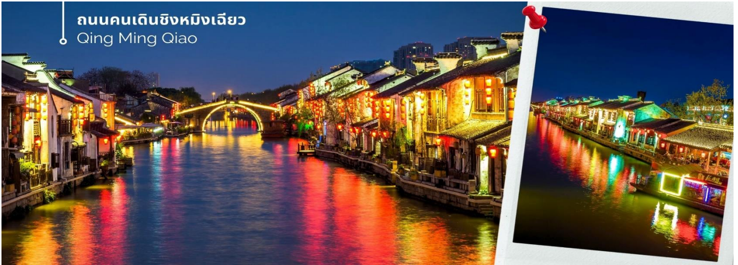
ถนนคนเดินชิงหมิงเฉียว

จากนั้นให้ท่านเดินชมบรรยากาศพื้นเมืองโบราณของ ถนนคนเดินชิงหมิงเฉียว เราจะได้เห็นบรรยากาศ บ้านเรือน สไตล์จีนโบราณ ร้านค้าต่างๆ ที่ขายสินค้าพื้นเมือง เสื้อผ้า ขนม ของประดับตกแต่ง ของฝาก ของที่ระลึกสวยๆ ให้เดิน ดูกันอย่างเพลิดเพลิน