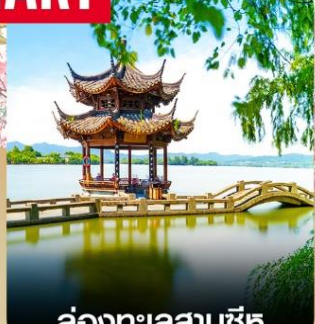
ล่องทะเลสาบซีหู