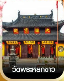
วัดพระหยกขาว