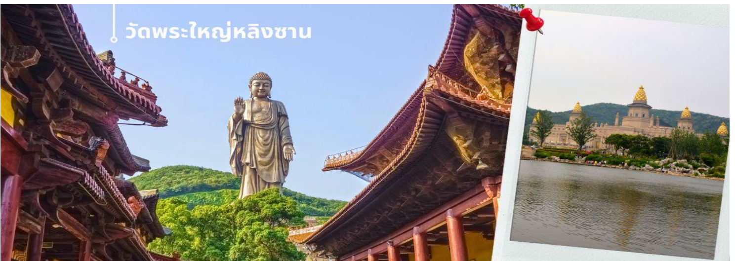
วัดพระใหญ่หลงซาน

จากนั้นนำท่านชม วัดพระใหญ่หลงซาน (นั่งรถราง) ตั้งอยู่ที่เมืองอู่ซี มณฑลเจียงซู ประเทศจีน สิ่งที่เห็นแบบเด่นชัดเมื่อมาเที่ยวที่วัดนี้คือ “หลงซานต้าฝอ” หรือ “พระใหญ่หลงซาน” พระพุทธรูปองค์ใหญ่ที่ใหญ่ที่สุดองค์หนึ่งในประเทศจีนและในโลก เป็นพระพุทธรูปปางยืนของพระอมิตาภพุทธะแบบสัมฤทธิ์กลางแจ้ง หนักกว่า 7,000 เมตริกตัน สร้างเสร็จเมื่อปลายปี ค.ศ. 1996 มีความสูงกว่า 88 เมตร (289 ฟุต) รวมฐานบัว 9 เมตร นักท่องเที่ยวทั้งชาวจีนและชาวต่างชาตินิยมมาขอพรเพื่อความสิริมงคลและความสำเร็จในหน้าที่การงาน การเดินทางให้แคล้วคลาดปลอดภัย โดยการกราบและลูบที่เท้าท่าน ซึ่งภายในพระพุทธรูปยังมีพิพิธภัณฑ์ชีวประวัติของท่านให้ได้เรียนรู้อีกด้วย ภายในประกอบไปด้วย ตำหนักผ่านกง หรือ ศาลาผ่านกง ตั้งอยู่ที่ริมทะเลสาบไท่หู ทางตะวันออกของพุทธอุทยาน ก่อสร้างราวปี 2006 บนเนื้อที่กว่า 7 หมื่นตารางเมตร เป็นที่รวมของศิลปวัฒนธรรมอันหลากหลายของพุทธศาสนาในแต่ละนิกายและแต่ละประเทศได้อย่างงดงามลงตัว จนถูกเรียกขานว่าเป็น “พิพิธภัณฑ์พุทธศิลป์ร่วมสมัยแห่งประเทศจีน” เพราะเป็นที่รวมของพิพิธภัณฑ์ นิทรรศการ โรงละคร คอนเสิร์ต และงานพุทธศิลป์มากมาย ที่น่าตื่นตาตื่นใจ