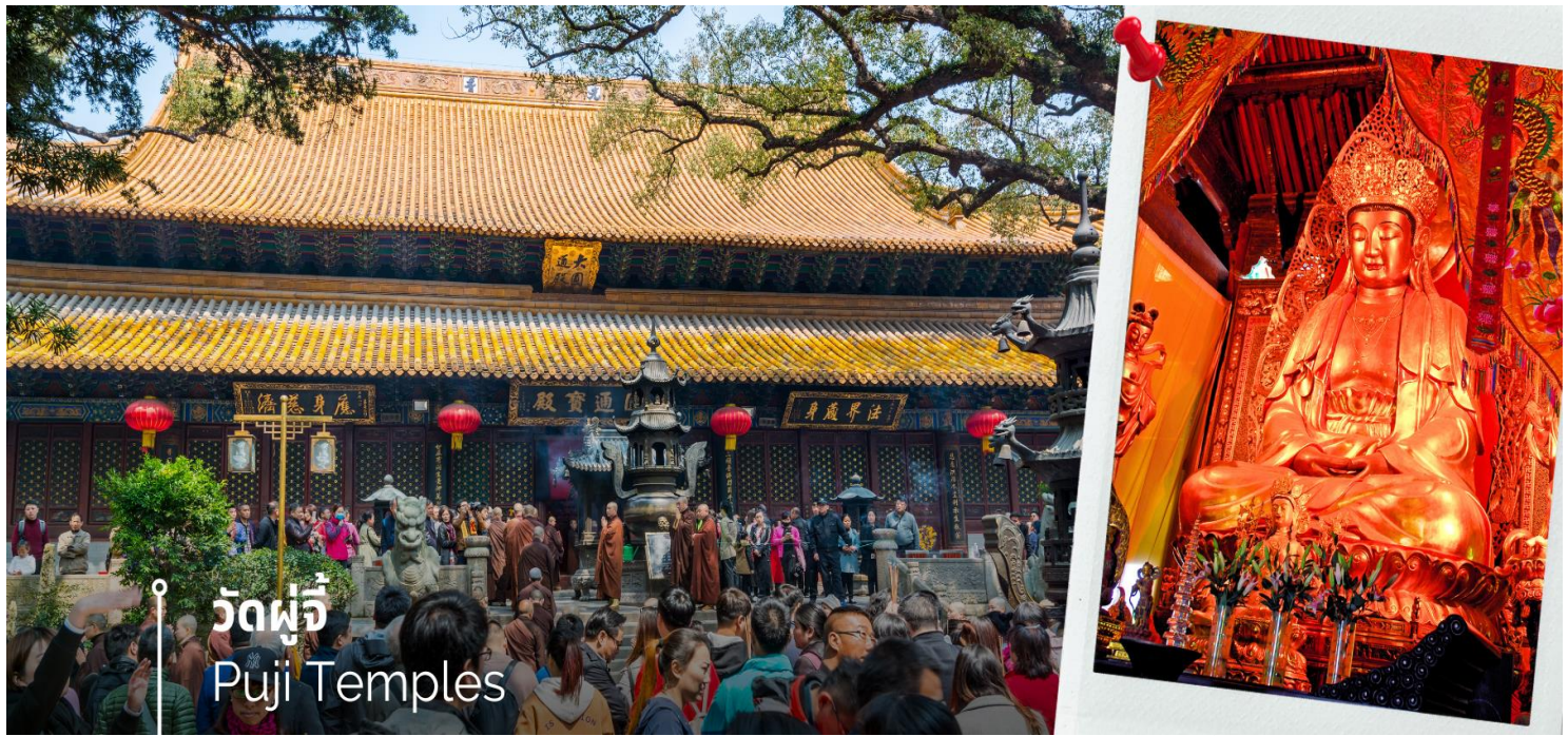
วัดผู้จี๋ Puji Temples

นำท่านข้ามเรือสู่ท่าเรือจูเจียเจียน เกาะผู้โถวซาน ซึ่งตั้งอยู่ที่ทะเลเหลียนฮั่วหยาง ซึ่งห่างจากอ่าวหังโจว มณฑลเจ้อเจียงไปทางทิศตะวันออกประมาณ 100 ไมล์ทะเล ซึ่งประกอบด้วยเกาะผู้ถ่อซานและลั่วเจียซานและเกาะจูเจียเจีย เกาะผู้ถ่อซานมีเนื้อที่เพียง 12.5 ตรกม วัดต่างๆ บนเกาะเริ่มสร้างในสมัยราชวงศ์ถังและซ่ง และเจริญรุ่งเรืองในสมัยราชวงศ์หมิงและชิง ปัจจุบันนี้ยังเหลือประมาณ 10 วัด นับเป็นภูเขาชื่อดังทางศาสนาพุทธ ติดอันดับหนึ่งในสี่ของจีน และเป็นธรรมสถานของพระอวโลกิเตศวรโพธิสัตว์ (พระแม่กวนอิม) โดยได้ฉายานามว่า “เป็นที่อยู่ของเหล่าเทพ” นำท่านสู่ วัดผู้จี๋ วัดในตำนานที่ควรมาเป็นอย่างยิ่ง โดยไฮไลท์ของวัดนี้คือ องค์พระโพธิสัตว์ที่มีเทพลักษณะเป็นชาย เป็นองค์ที่ชาวจีนทั่วโลกให้ความเลื่อมใสศรัทธาสูงสุด ซึ่งวัดผู้จี๋เนี่ย เป็นวัดใหญ่ที่สุดบนเกาะที่มีประวัติเก่าแก่นับพันปี แต่เดิมเนี่ยเป็นวัดเล็ก แต่ผ่านร้อนผ่านหนาวมา ตั้งแต่ยุคราชวงศ์ซ่ง หยวน หมิง และชิง จนกระทั่งได้รับพระราชทานนาม “ผู้จี๋” จากจักรพรรดิคังซีแห่งราชวงศ์ชิง ส่วนในรัชสมัยของจักรพรรดิหย่งเจิ้งก็ได้รับการบูรณะครั้งใหญ่จนกลายเป็นวัดที่มีขนาดใหญ่และสำคัญที่สุดบนเกาะ ภายในมีพื้นที่กว้างขวาง มีสถาปัตยกรรมวิจิตรตรงตามมากมาย