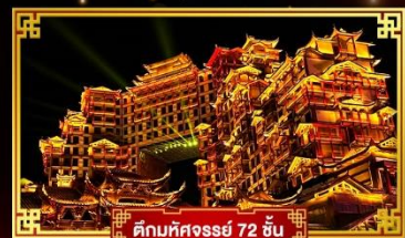
คัมภีร์ศงสรย์ 72 ชั้น