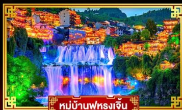
หมู่บ้านฟุ่หลงเจิน