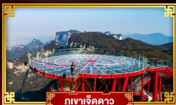
กุเวาเจ็ดดาว

“ฟุ่หลงเจิน” อสังการหมู่บ้านโบราณริมน้ำตก