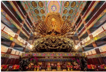
ในเมืองจ้อไบ๊

จากนั้นนำท่านเดินทางสู่ จ้อไบ๊ เอ้อเหมยแปลว่าคิ้วโก่ง เพราะทิวเขามีลักษณะเหมือนคิ้วนักพรตในลัทธิเต๋าเริ่มเข้ามาสร้างศาลเจ้าในเทือกเขาแห่งนี้ในศตวรรษที่ 2 หลังจากนั้นศาสนาก็เริ่มเฟื่องฟูมาจนถึงศตวรรษที่ 6 เอ้อเหมยซานจึงกลายมาเป็น 1 ใน 4 ภูเขาศักดิ์สิทธิ์ทางพุทธศาสนา (เอ้อเหมยซาน, อุโกซาน, จิวหวงซาน, ฟูโกซาน) นำท่านเดินทางสู่ วัดวิปัสสนาพระใหญ่ จ้อไบ๊ ซึ่งเป็นวัดวัดที่ทำการสอนพุทธศาสนาที่ใหญ่ที่สุดในเอเชีย มีวิหารประดิษฐานเจ้าแม่กวนอิมพิมพ์มือ ทองสัมฤทธิ์ สูง 12 เมตร อยู่