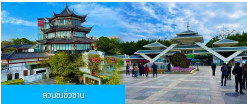
สวนชิวชิวซาบ

อิสระอาหารมื้อเย็น เพื่อความสะดวกในการเดินช้อปปิ้ง ลิ้มรสอาหารท้องถิ่นหลากหลายรสชาติได้ตามอัธยาศัย พักที่ UNIVERSAL HOTEL ระดับ 4 ดาวท้องถิ่นหรือเทียบเท่าในเมืองหนานหนิง