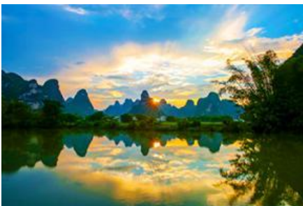
ระเบียบภาพร้อยลี้

พักที่ MINGSHI YISHU HOTEL ระดับ 3 ดาวท้องถิ่นหรือเทียบเท่าในอุทยานหมิงชื่อ