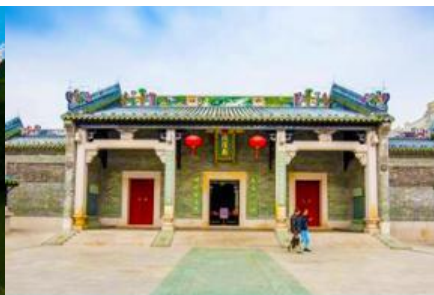
วัดเจิวหวงเมี่ยว