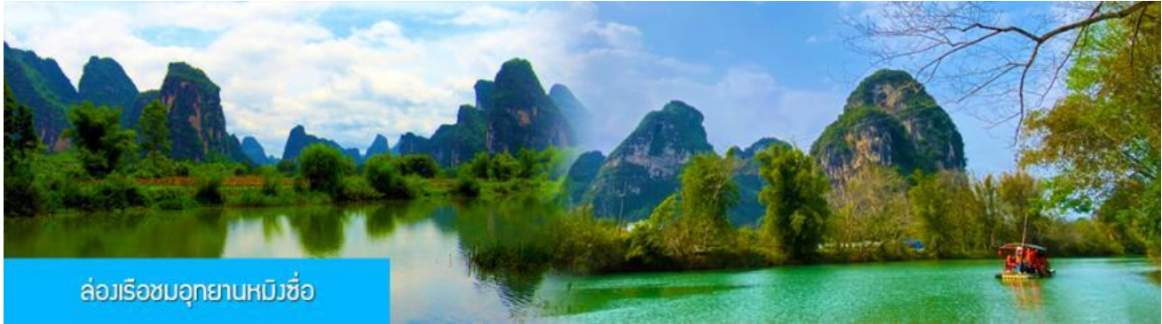
ล่องเรือชมอุทยานหมิงชื่อ