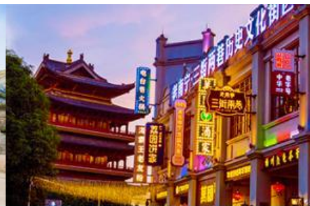
ย่านช้อปปิ้งเหลียงเซียง