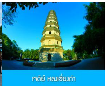
เจดีย์ หลวงเซียงก่า