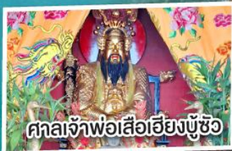
ศาลเจ้าพ่อเสือฮึงบูซิว