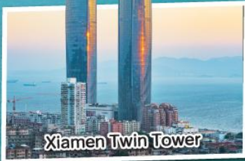
Xiamen Twin Tower