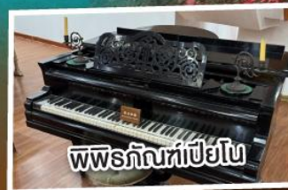
พิพิธภัณฑท์เปียวโน

พัก 4 ดาว เมนูพิเศษ!!! เปิดปังกิ่ง อาหารแต่จิว 18 อย่าง