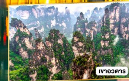
เวาอวตาร