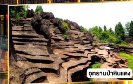
อุทยานป่าหินแดง