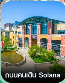
ถนนคนเดิน Solana

✈ คอนเฟิร์ม ออกเดินทาง ทุกมีเรียค 2 ท่านขึ้นไป