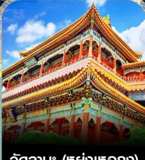
วัดลามะ (หย่งเหอกง)