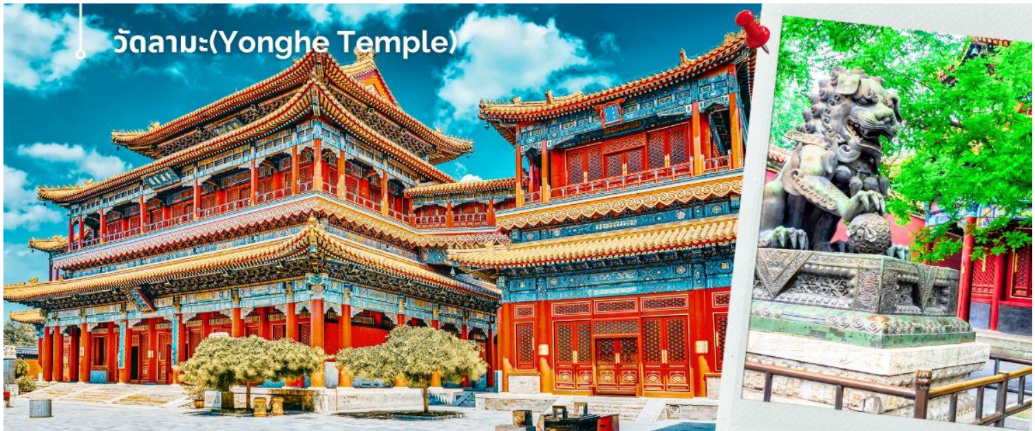
ผสมผสานวัฒนธรรมจีนและทิเบตได้อย่างลงตัว

นำท่านชม วัดลามะ(Yonghe Temple) หรือ วัดยงเหอ เป็นวัดพุทธแบบทิเบตที่ใหญ่ที่สุดแห่งหนึ่งในประเทศจีน มีประวัติศาสตร์อันยาวนาน ตั้งอยู่ใจกลางกรุงปักกิ่ง เนื้อที่กว่า 6 หมื่นตารางเมตร โดดเด่นด้วยสถาปัตยกรรมที่งดงาม วิจิตรบรรจง สร้างขึ้นในสมัยราชวงศ์ชิง เมื่อปี ค.ศ. 1744 เดิมทีเป็นพระราชวังขององค์ชายสี่ บางครั้งจึงเป็นที่รู้จักในชื่อว่า วัดองค์ชายสี่ ต่อมาได้ปรับเปลี่ยนเป็นวัดพุทธแบบทิเบต โดยได้รับอิทธิพลจากศาสนาพุทธนิกายนิคายเกลูกปา ซึ่งเป็นนิกายที่สำคัญในทิเบต ที่นี่ไม่เพียงแต่เป็นสถานที่สำคัญทางศาสนาเท่านั้น แต่ยังเป็นสัญลักษณ์ของการ