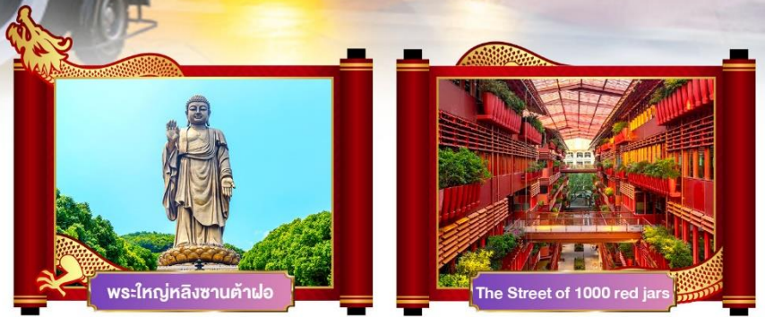
พระใหญ่หลังซานต้าฟอ