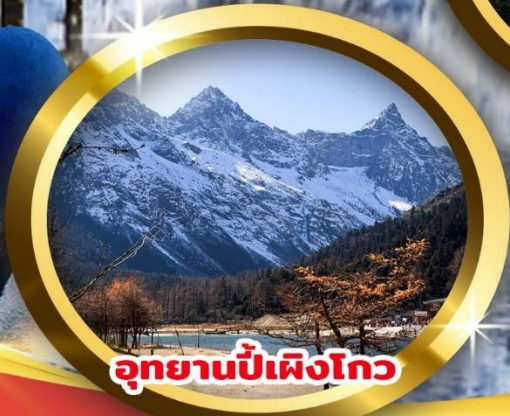
อุทยานปี้เผิงโกว