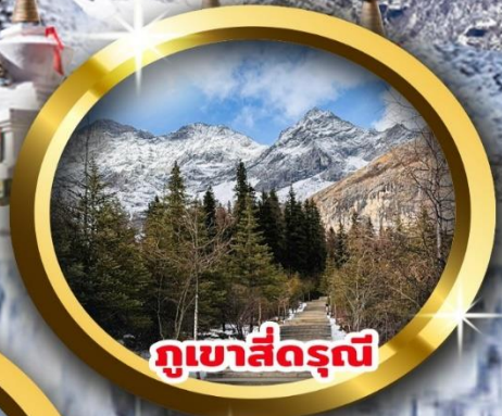
กุหลาบสีดรุณี