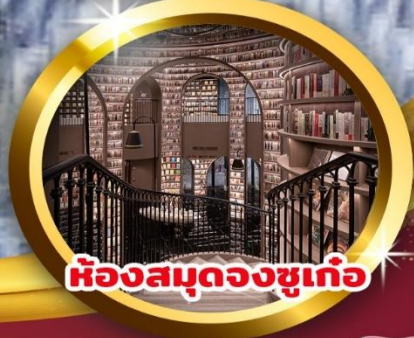
ห้องสมุดงูชู่เก้อ