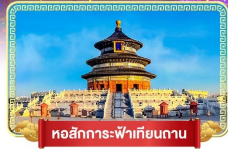
หอสักการะฟ้าเทียนถาน