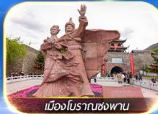
เมืองโบราณซ่งพาน