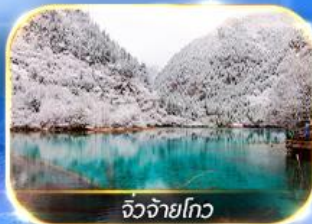
จิวจ้ายโกว