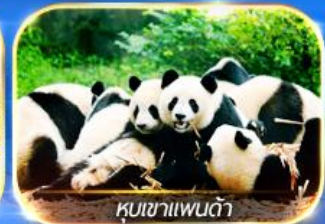
หุบเขาแพนด้า

สัมผัสความงามของธรรมชาติ 2 อุทยาน อุทยานจิวจ้ายโกวและอุทยานน้ำแข็งท่ากู่ นั่งรถไฟความเร็วสูง ชมความน่ารักของน้องหมีที่หุบเขาแพนด้า ซอปปิ้งที่ไท่กู่หลี่ ดูแพนด้ายักษ์ป็นตึก