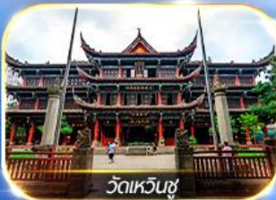
วัดเหวินชู่