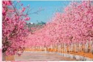
หุบเขาซากุระ