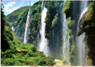
เปิดกร้อยสาย