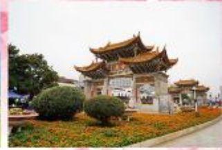
ประตูป่าทองไห่หยก