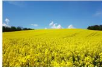
ทุ่งดอกบ๊วยลดาสด