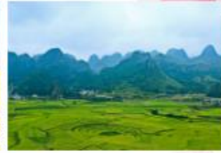
ป่าภูเขาหมื่นยอด