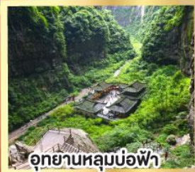
อุทยานหลุมบ่อฟ้า