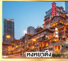
หงหยาดัง