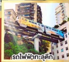
รถไฟฟ้ากะลุติ๊ก