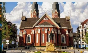
หมู่บ้านจำลองลูเซิร์น