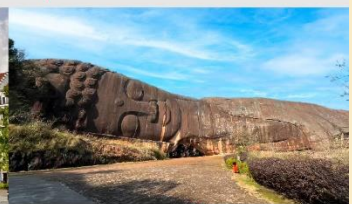
พระนอนอี้หยาง

*ทางบริษัทฯ ขอสงวนสิทธิ์ในการสลับโปรแกรมทัวร์ตามความเหมาะสมขึ้นอยู่กับสถานการณ์หน้างาน โดยคำนึงถึงผลประโยชน์ของลูกค้าเป็นสำคัญ