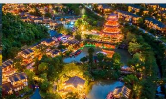
หมู่บ้านเกอเซียน