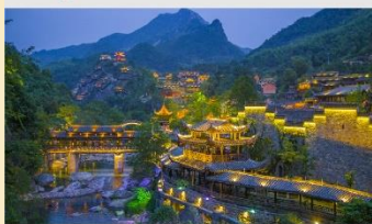
หุบเขาเทวดาวังเซียนกู่