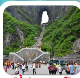
"กำแพงประตูสวรรค์"