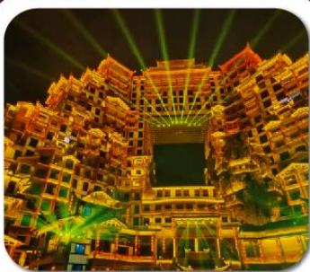
"ตึกมหัศจรรย์ 72 ชั้น"

นั่งกระเช้าชมภูเขาเทียนเหมินซาน • กำแพงประตูสวรรค์ • ทางเดินกระจก เมืองโบราณเพิ่งหวง • ล่องเรือแม่น้ำถั่วเจียง • เมืองโบราณฟูหรงเจิน ภูเขาเทียนจื่อซาน (รวมลิฟต์แก้ว) • หุบเขาอวตาร • ตึกมหัศจรรย์ 72 ชั้น