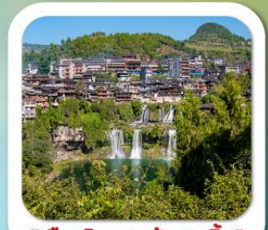
"เมืองโบราณฟูหรงเจิน"