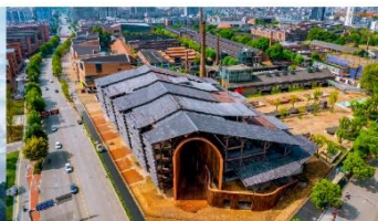
ลานวัฒนธรรมเกาซีชว่น