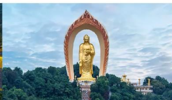
พระใหญ่ต่งหลิน