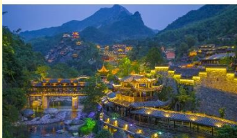
หุบเขาเทวดาวังเซียนกู่