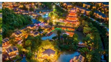
หมู่บ้านเกอเซียน

*ทางบริษัทฯ ขอสงวนสิทธิ์ในการสลับโปรแกรมทัวร์ตามความเหมาะสมขึ้นอยู่กับสถานการณ์หน้างาน โดยคำนึงถึงผลประโยชน์ของลูกค้าเป็นสำคัญ