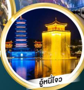
อุ๋หนี่โจว