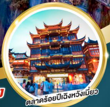
ตลาดร้อยปีเจิ้งหวังเมี่ยว