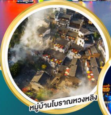
หมู่บ้านโบราณหวงหลิง